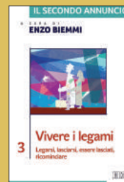
Vivere i legami. Legarsi, lasciarsi, essere lasciati, ricominciare EDB, 2016